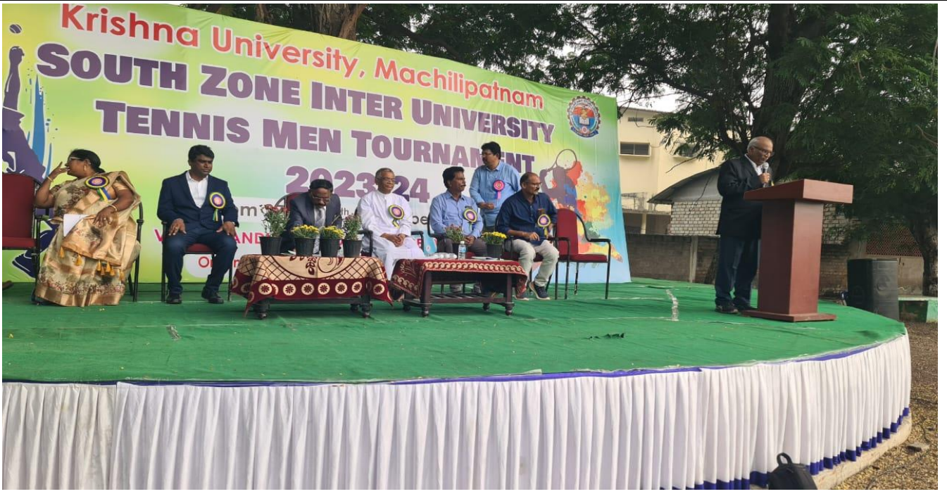
Inaugural Session of All India Inter University Tennis Tournament (South Zone) at Andhra Loyola College, Vijayawada, on December 24, 2023