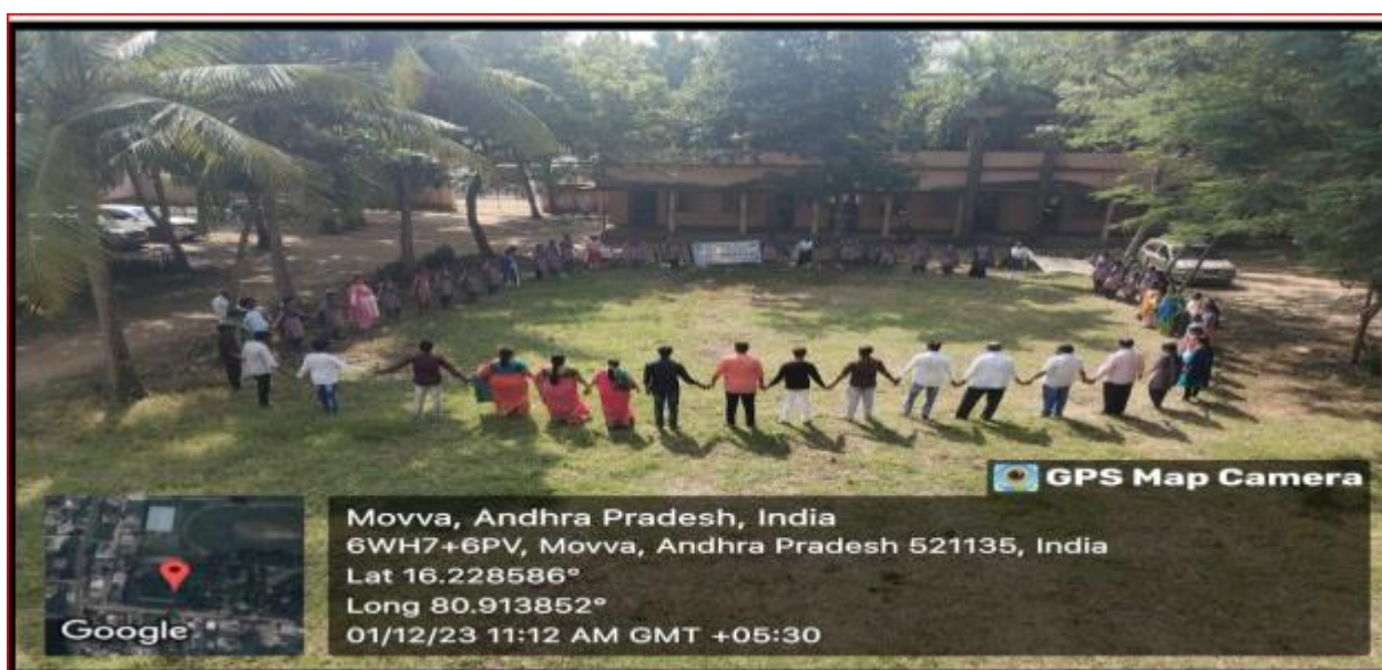
The formation of a human chain by our staff and students, on the Occasion of World Aids Day.