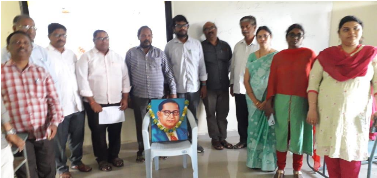
Faculty paying tributes to on the occasion of Dr. B.R Ambedkar Death Anniversary on on 6 December 2023