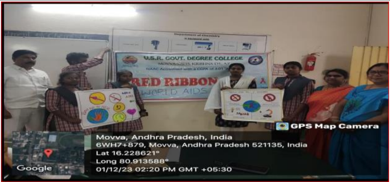
Students participating in Poster making Competition on 1 December 2023