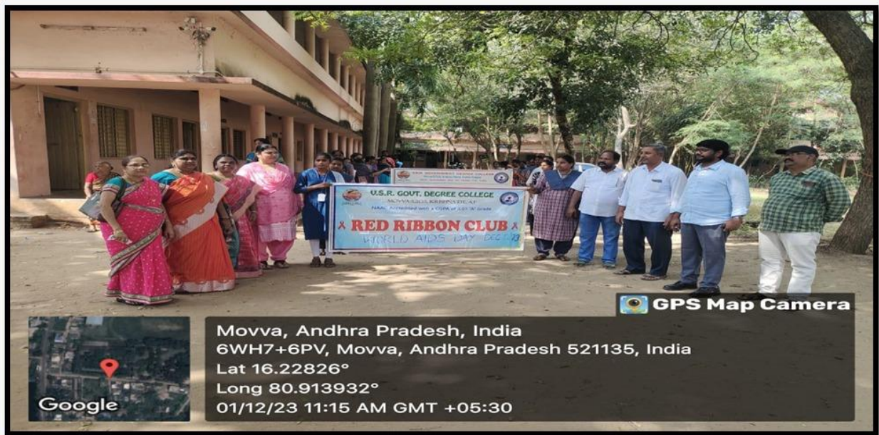
A vibrant rally was organized, featuring students, faculty, and staff on 1 December 2023