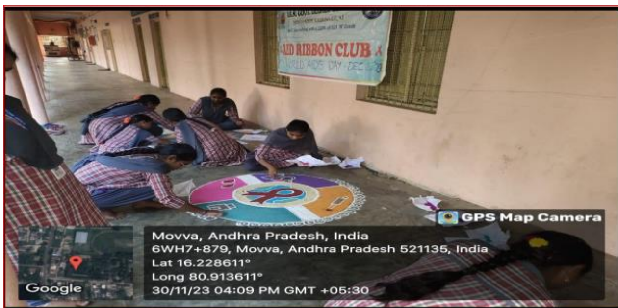
On 1 December 2023, students making Rangolis, on the Occasion of World Aids Day.