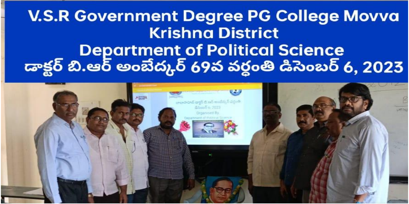
Faculty paying tributes to Dr. B.R Ambedkar

The political Science Department of VSR GDC solemnly commemorated the Dr. B.R Ambedkar Death Anniversary on 6 December 2023, with heartfelt staff speeches and tributes. Faculty members eloquently highlighted the enduring impact of Dr. Ambedkar's vision for social justice, equality, and human rights. Emphasizing his pivotal role in drafting the Indian Constitution, speakers reflected on the continued relevance of his ideals. The event fostered a sense of unity and commitment to upholding Dr. Ambedkar's legacy. Through poignant tributes, the VSR GDC community honored the profound contributions of Dr. B.R Ambedkar, renewing their dedication to fostering an inclusive and equitable society.